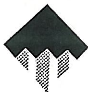
ÉPÍTÉSI VÁLLALKOZÓK ORSZÁGOS SZAKSZÖVETSÉGE